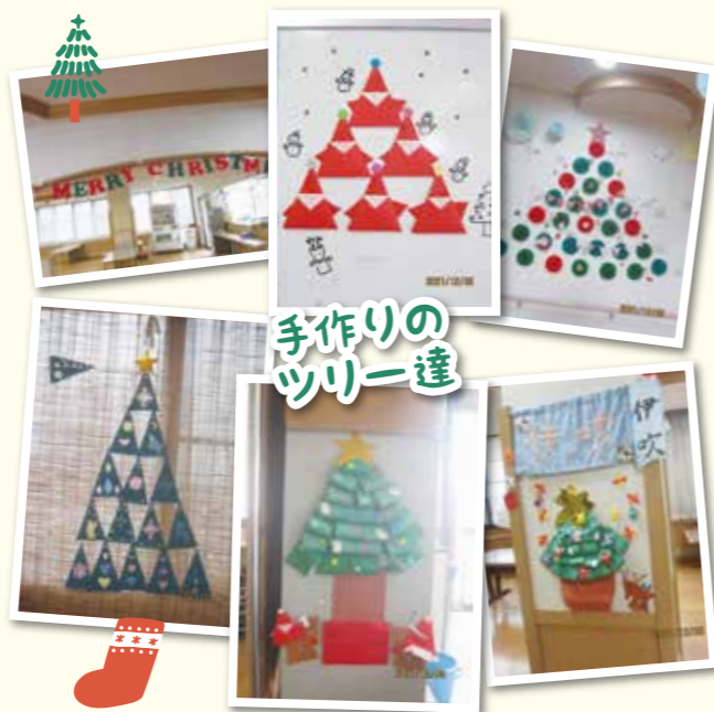
手作りのツリー達

12月には、クリスマス会、忘年会をしました。かわいい飾り付けがとても印象的でした。