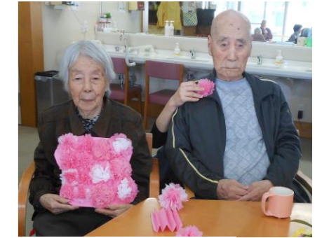
皆でにぎやかに過ごしています(^^)