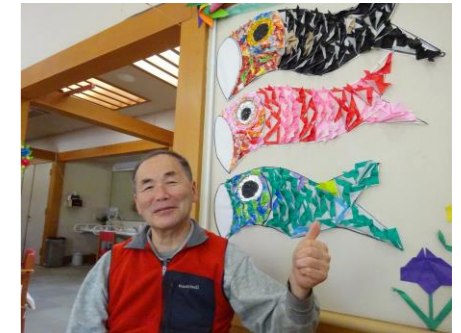
レクリエーション・体操・お誕生日会など・・・♪