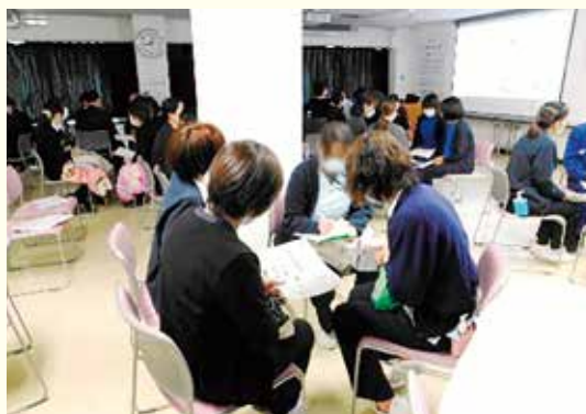
研修会グループワーク